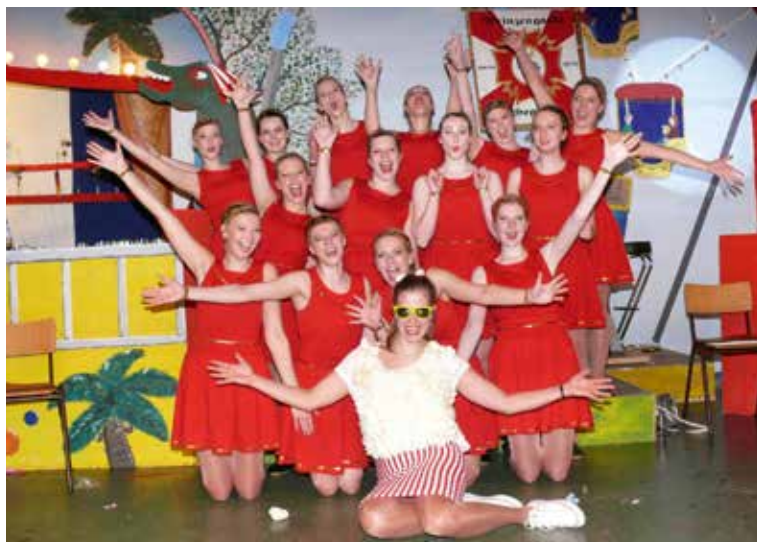
Funkengarde im Jahr 2017